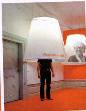
Smarter Kopfputz bei berlindesign (l.) und die Erleuchtung von SEHW Architektur