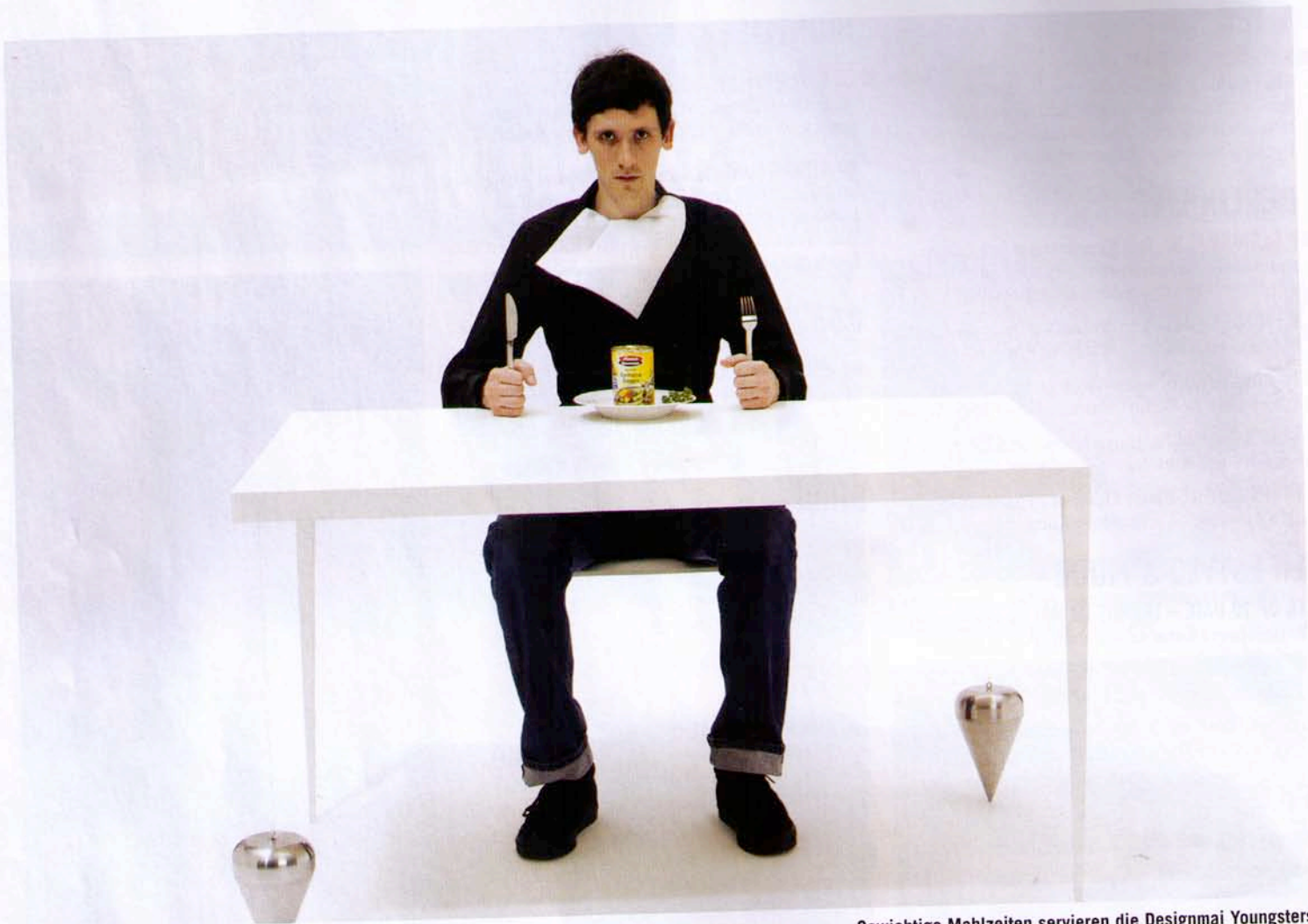
Gewichtige Mahlzeiten servieren die Designmai Youngsters